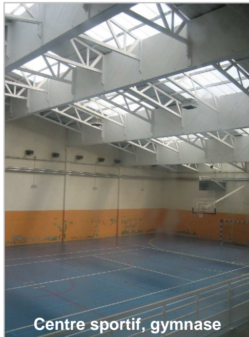
Centre sportif, gymnase