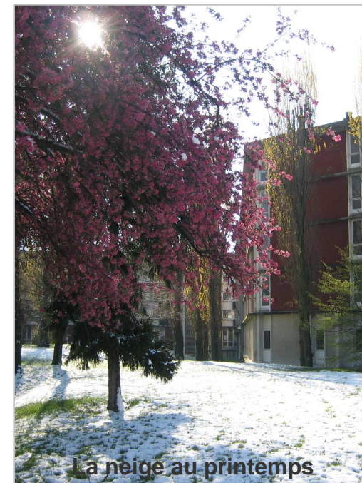
La neige au printemps

Jean Zay : ancien Ministre de l'Education Nationale