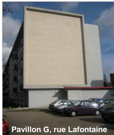
Pavillon G, rue Lafontaine