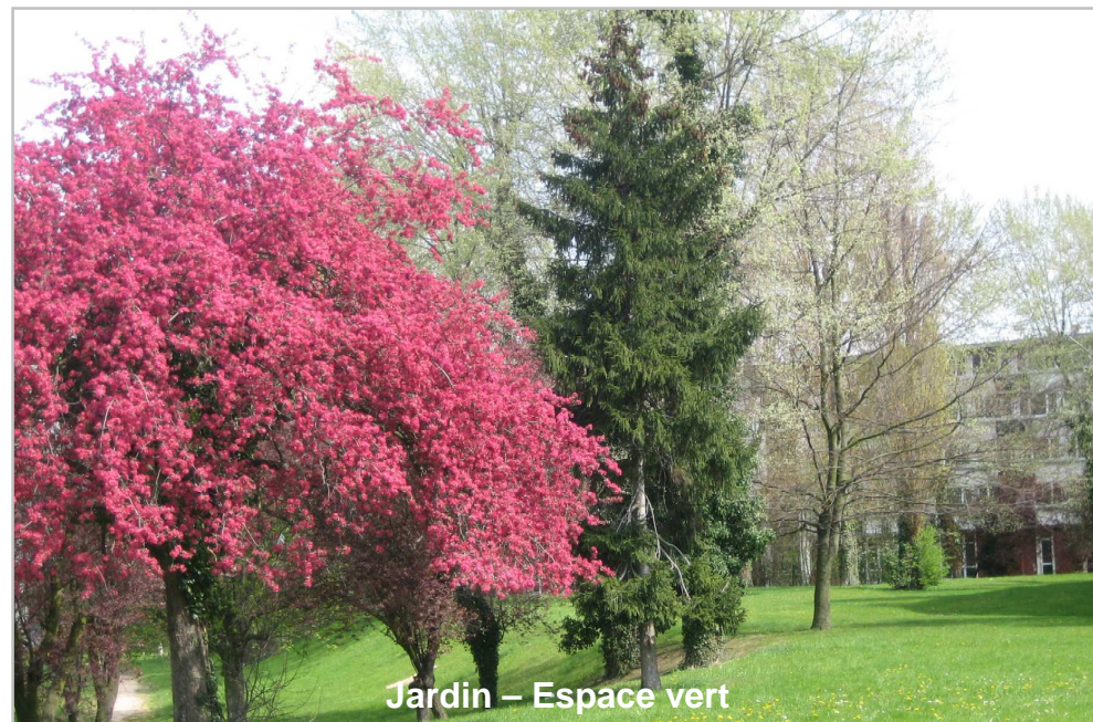
Jardin – Espace vert