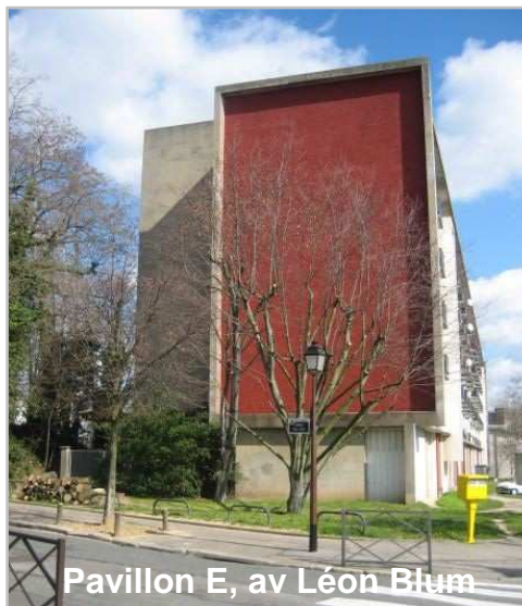
Pavillon E, av Léon Blum