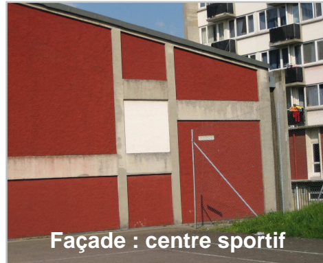
Façade : centre sportif