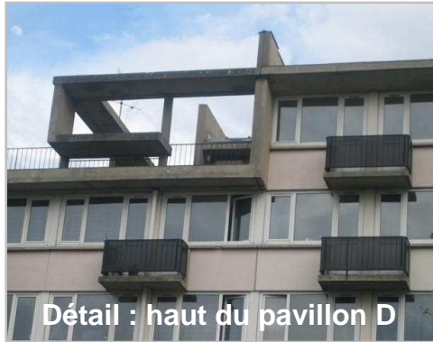
Détail : haut du pavillon D