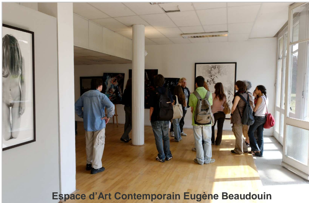
Espace d'Art Contemporain Eugène Beaudouin